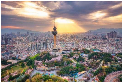
大邱タワー・E-world（遊園地）と達西区の街並み