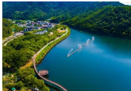
山と湖の景観を同時に楽しむことのできる月光水辺公園