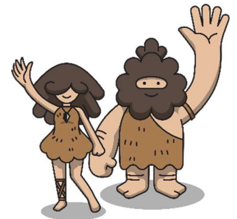
旧石器人をモチーフにしたキャラクター「タルス」(右)と「タルヒ」(左)